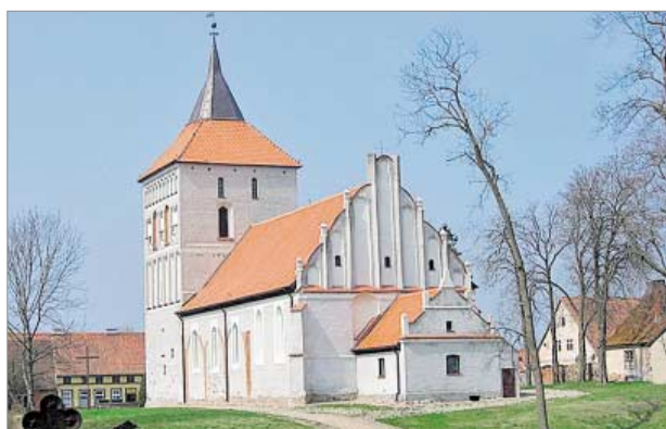
♦ Kościół w Szestnie