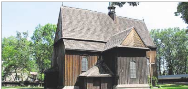
♦ Kościół św. Bartłomieja w Krakowie Mogile

w rozwoju regionu. Drogi żelazne, pojawiając się w XIX w. w Europie, zrewolucjonizowały ówczesny świat.