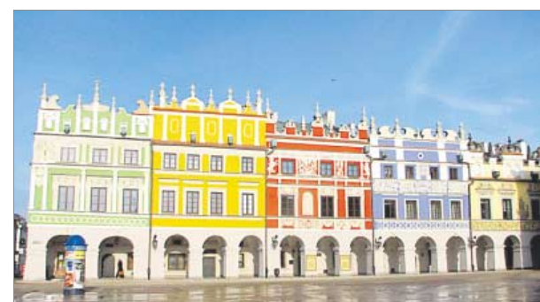
♦ Kamienice w Zamościu

Ciekawy program przygotowały także mniejsze miejscowości. Gmina Gościeradów organizuje konferencję „Śladami historii”, powiat biały zaprasza na wycieczkę rowerową po te-