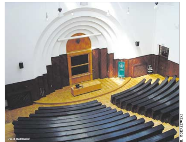
♦ Aula Szkoły Głównej Handlowej