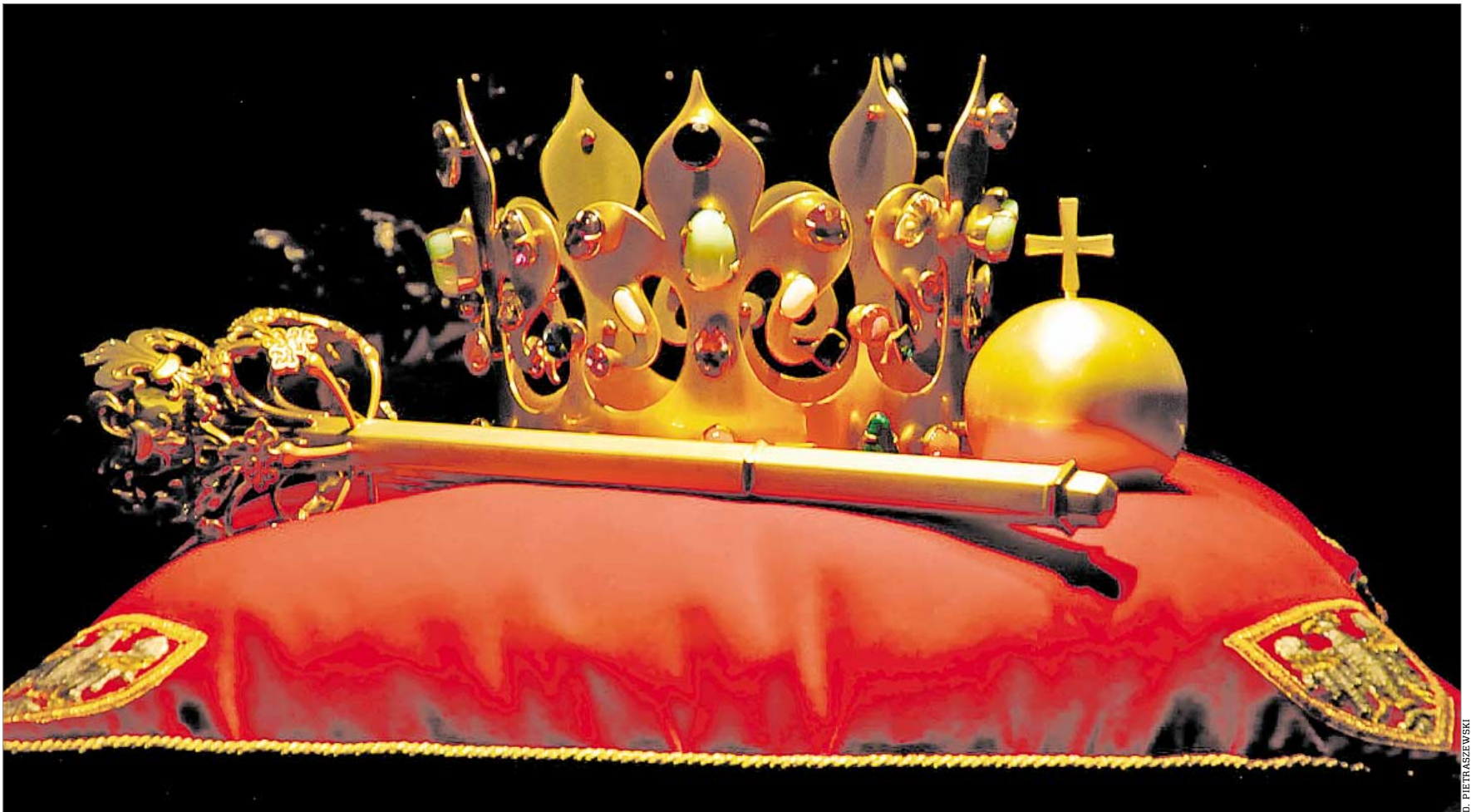
♦ Korona, berto i jabłko Kazimierza Wielkiego. Kraków 1370. Kopie insygniów grobowych