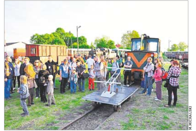
♦ Stacja Rogów Wąskotorowy

Fundacja Kolei Wąskotorowej Rogów - Rawa - Biała zaprasza do izby muzealnej Magazyn No 1, znajdującej się na stacji Rogów Towarowy Wąskotorowy, gdzie będzie można wysłuchać prelekcji na temat historii Kolei Rogowskiej, która, splatając się zaskakująco często z ważnymi wydarzeniami historycznymi Polski i Europy, stanowi kamień milowy