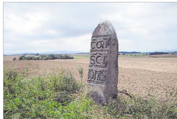
♦ Granica św. Jana

Wiele imprez będzie poświęconych historycznym wynalazkom – Muzeum Papiernictwa w Dusznikach-Zdroju organizuje m.in. warsztaty czerpania papieru, a wrocławski Klub Sympatyków Kolei zaprasza do zwiedzania zajezdni i na przejażdżkę drezynami.