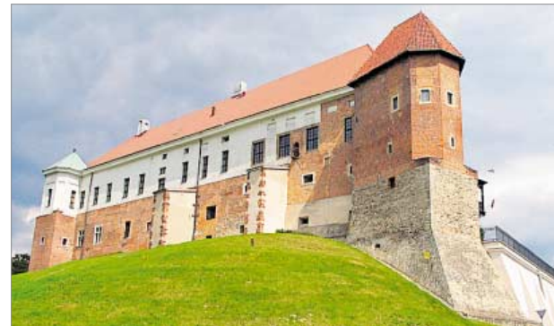
♦ Zamek Sandomierski

Na obchody EDD zapraszają też Chęciny – dawne miasto królewskie, znane z malowniczych ruin zamku. Swoją ciekawą historię zaprezentują Lisów, Maleszowa i Piotrkowice – trzy miejscowości należące do tzw. klucza maleszowskiego, rodowego majątku Krasieńskich.