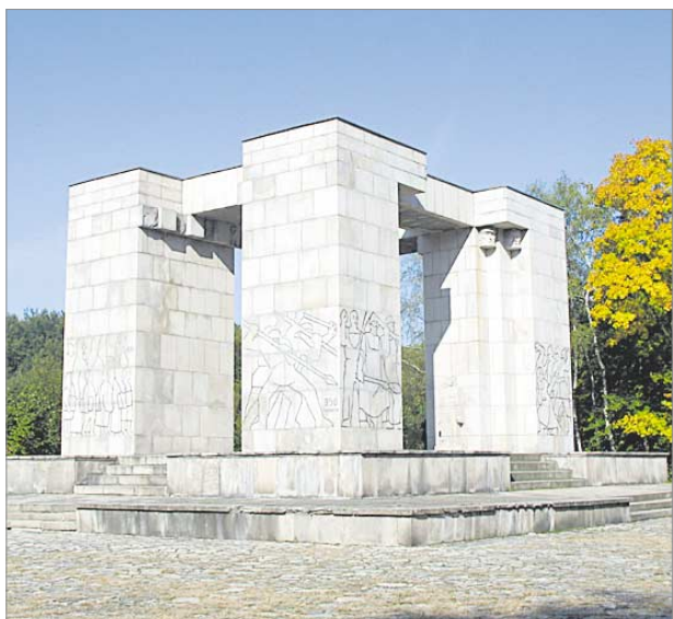
♦ Pomnik Czynu Powstańczego na Górze św. Anny