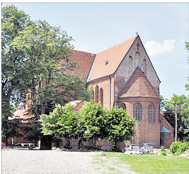
♦ Kamień Pomorski, widok na prezbiterium katedry

szej Maryi Panny w Kotłowie, zabytki Ostrowa Wielkopolskiego i Gostynia.