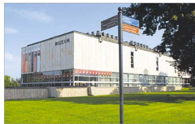
♦ Gniezno. Muzeum Początków Państwa Polskiego

Centrum Turystyki Kulturowej TRAKT w Poznaniu organizuje „Królewskie zmagania na Ostrowie Tumskim” (10 i 17 września), zaś Koło Przewodników PTTK im. Mottego „Przechadzki po Poznaniu” (4, 11, 18 i 25 września). Narodowy Instytut Dziedzictwa Oddział Terenowy w Poznaniu zaprasza 17 września na wycieczkę autokarową szlakiem kamieni miło-