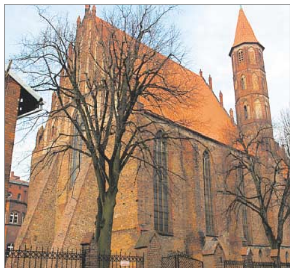
♦ Kościół św. Jakuba Apostoła i św. Mikołaja w Chełmnie