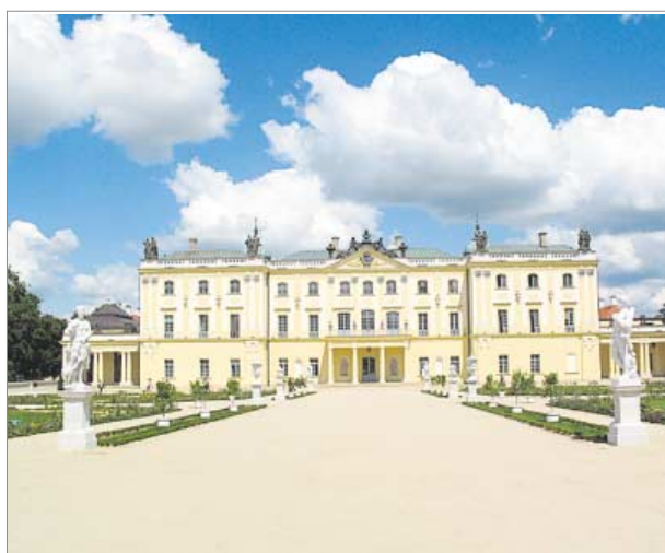
▲ Pałac Branickich. Elewacja ogrodowa

cja dawnego Rzeszowa przygotowana na podstawie planu z 1762 roku. Muzeum Budownictwa Ludowego w Sanoku zaprasza na zwiedzanie zabytkowych świątyń i warsztaty pisania ikon.