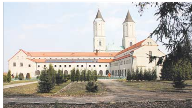
▲ Jarosław. Opactwo Benedyktynek