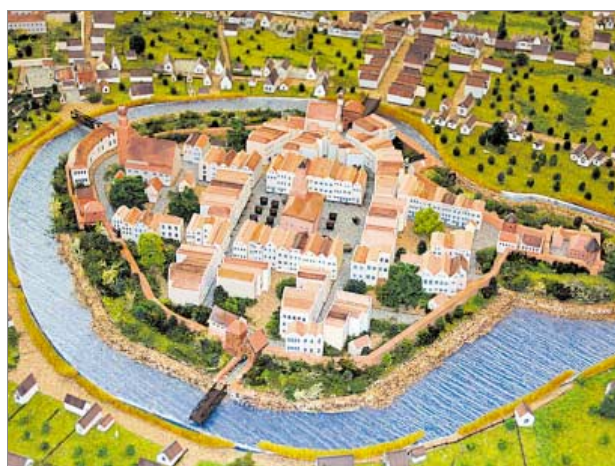
♦ Makieta historyczna miasta Wschowy. Obraz miasta z przełomu XVII – XVIII w.

lnu i koronkarskich. Również Międzyrzec Podlaski przygotowuje cykl pokazów dawnego i współczesnego rękodzieła, wystawy i konkursy.