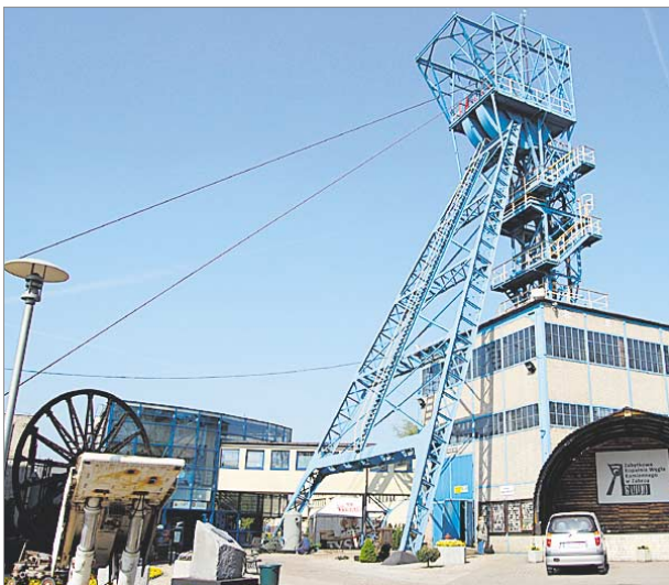
▲ ZKWK „Guido” w Zabrze

wano wiele wystaw: m.in. „Rzucewo – archeologia, kultura, ludzie”, „Droga do wolności – Generał Haller nad Bałtykiem” oraz „Rybołówstwo nad Zatoką Pucką”.