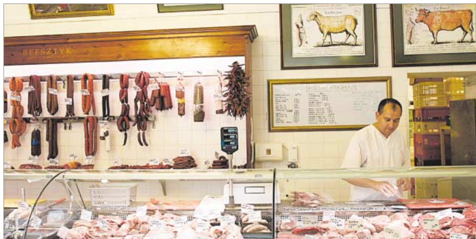
Wołowina nie powinna leżeć w sklepie obok drobiu lub wieprzowiny

To kwestia praktycznych rozwiązań. Gdy mamy dużą rodzinę, możemy zamrozić duży kawał i później go ugotować. Jednak trudno wymagać