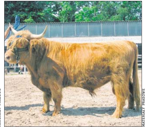
♦ Rasa mięsna Highlander