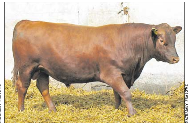
♦ Rasa mięsna Angus czerwony