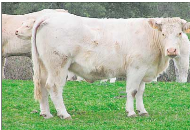
♦ Rasa mięsna Charolaise