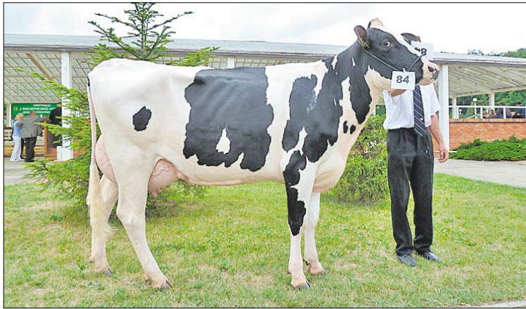
♦ Rasa mleczna czarno-biała