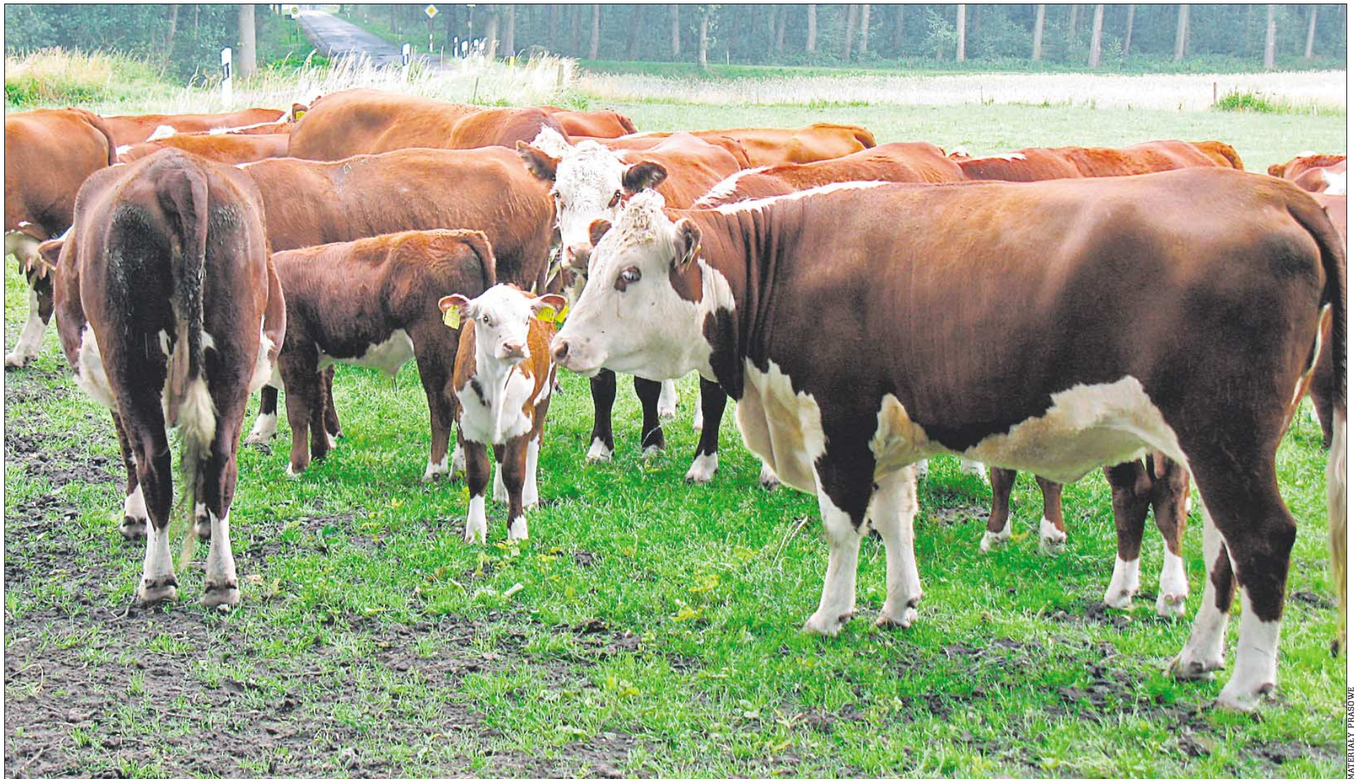
• Dobrej jakości wołowina dostarcza wielu składników odżywczych, m.in. witamin z grupy B i wielonienasyconych kwasów tłuszczowych