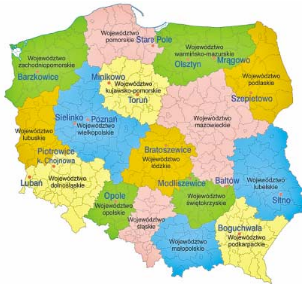
HARMONOGRAM WYSTAW HODOWLANYCH ORAZ IMPREZ PLENEROWYCH W 2011 R.

Piknik na terenie Zespołu Szkół Gastronomiczno-Hotelarskich w Toruniu, 2 czerwca