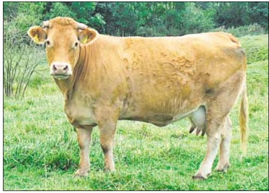
♦ Rasa mięsna Limousine