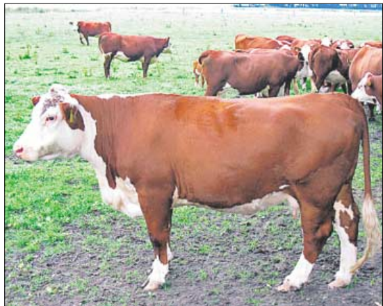
♦ Rasa mięsna Hereford