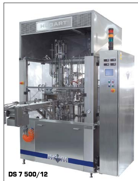
DS 7 500/12

awansowanych systemów pakowania. Poza urządzeniami napełniająco-zamykającymi, konstruujemy również urządzenia grupujące, kartonujące, a także sztaplujące oraz paletyzujące. Dzięki tak szerokiej gamie produktów, jesteśmy w stanie zaoferować naszym klientom kompleksowe rozwiązania ciągów pakujących.